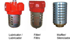
Lubricator / Lubricador Filter / Filtro Muffler / Silenciador